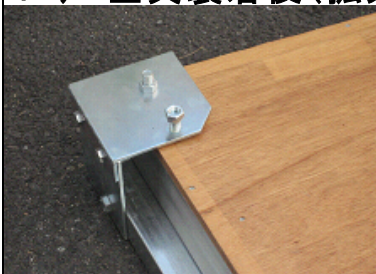
コーナー金具装着後(拡大)