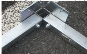
コーナー部分拡大(コーナー金具未装着)